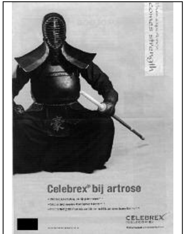
Hoezo "Kendo, goed voor lichaam en geest"?

LOCATIE: DEN HAAG DOJO: KENDO KAI SUZUKI WEBSITE: WWW.KENDOKAISUZUKI.COM ADRES: DE HAAGSE BEEK PADDEPAD 6 DEN HAAG (ZA / WO) VISSER 'T HOOFT LYCEUM KAGERSTRAAT 1 LEIDEN (VR) CONTACT: S. SUZUKI KAAPSE PLEIN 137 2572 NH DEN HAAG TEL: 070-3802890 INFO@KENDOKAISUZUKI.COM KENDO: VR 20.00 - 22.00 ZA 12.30 - 14.30 WO 20.00 - 22.00 IAIDO: - JODO: -