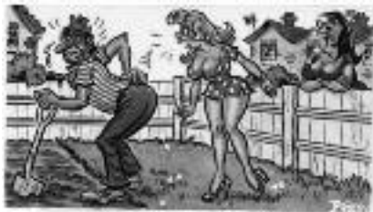
Stil aan de coördinator, jij moet dat wel naar de buurvrouw!

“Zo, je bent klaar, maar je moet nog wel even naar de buurvrouw.” (He, dat maak ik zelf wel uit, denk ik nog even)